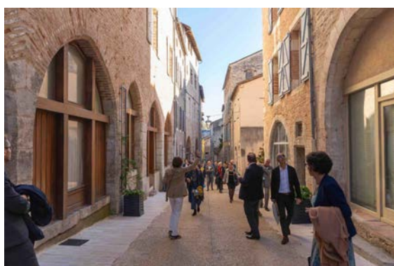
Figure 4 : Visite du centre-ville de Cahors, lors des Rencontres des villes moyennes

concentrent sur l'œnotourisme (bannière « Destination Cahors Malbec » portée par le Grand Cahors, la Communauté de communes de la Vallée du Lot et du Vignoble et les professionnels de la filière), l'agritourisme et le géotourisme (PNR des Causses du Quercy labellisé Géoparc par l'UNESCO, plage au Ptérosaures etc.), appuyés par une offre de formation spécifique. Par ailleurs pour mieux relier ces différents sites, l'aménagement de voies vertes, de promenades ou encore du chemin de Saint Jacques de Compostelle ainsi que le développement de la mobilité douce le long des espaces verts et sur les rives du Lot sont mis à l'honneur. Ce paysage de nature se prolonge au cœur de la ville avec de nombreux parcs et jardins reconnus au niveau international qui rivalisent de créativité au point de se voir récompensés par le ministère de la Culture, comme les Jardins Secrets, nommés « Jardin Remarquable ». Référence nationale, Cahors affiche un total de 250 points fleuris et près de 300 000 plantes sur son territoire. Cette orientation s'inscrit dans un positionnement plus global des « 3 E » pour les trois axes stratégiques retenus pour le développement économique et pour celui d'un tourisme de qualité et non de masse (Éthique, Esthétique et Environnement).