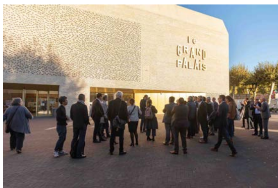
Figure 5 : Le Grand Palais, Cahors

Toutefois le tissu urbain issu du Moyen-Âge peut ne pas toujours correspondre aux attentes de confort des habitants : ruelles étroites et sombres, logements de taille réduite ou avec une disposition d'une seule pièce de vie par étage. C'est pourquoi la ville s'est engagée dans une démarche originale permettant de créer des « zones d'aération contrôlée » par la démolition ciblée (limitée à 20% de la parcelle concernée et sous contrôle d'un architecte des bâtiments de France) ainsi que dans l'agrandissement de certains logements par fusion de plusieurs unités afin de privilégier les surfaces à l'horizontale plutôt qu'à la verticale.