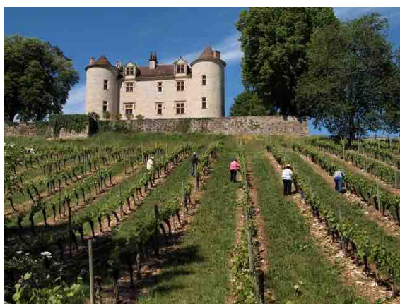
Figure 3 : Château Lagrézette, vignoble de Cahors

L'agriculture et le tourisme sont les deux autres piliers de l'économie du Grand Cahors. Tous deux subissent aujourd'hui une transformation volontariste pour monter en gamme et répondre aux objectifs de réduction de l'impact carbone.