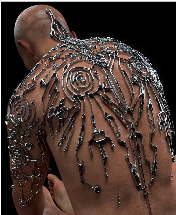
Sam Madhu Lithium Flower © Sam Madhu, 2023