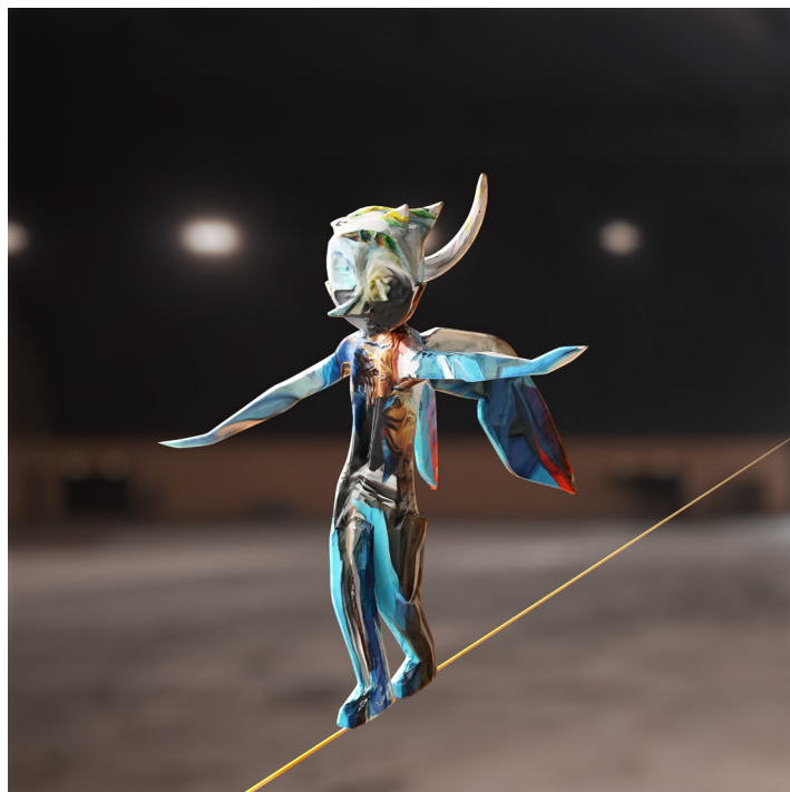
Liu Bolin The Tightrope Walker