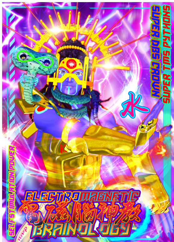
Lu Yang Electromagnetic Brainology © Lu Yang, 2017