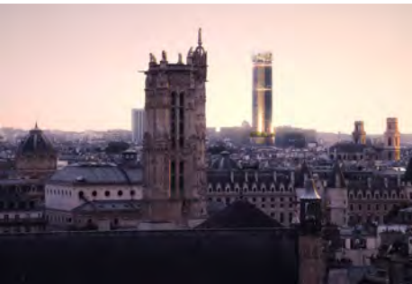
Vue depuis le toit du centre Georges Pompidou

Un grand merci à Model Workshop pour leur travail sur la maquette.