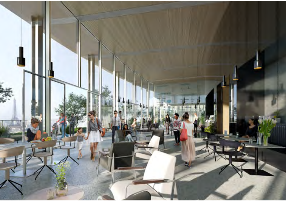
Café du jardin au 14 e étage