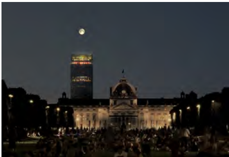
Vue du champ de Mars