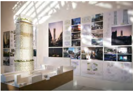
© Nouvelle AOM / Camille Gharbi