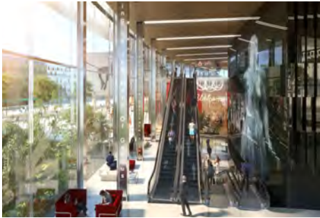
© Nouvelle AOM / IDA+ Vue du hall principal des bureaux