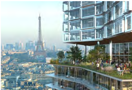
© Nouvelle AOM / IDA + Vue sur le jardin suspendu