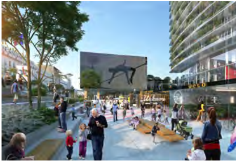
© Nouvelle AOM / IDA+ Vue du parvis, rue de l'Arrivée