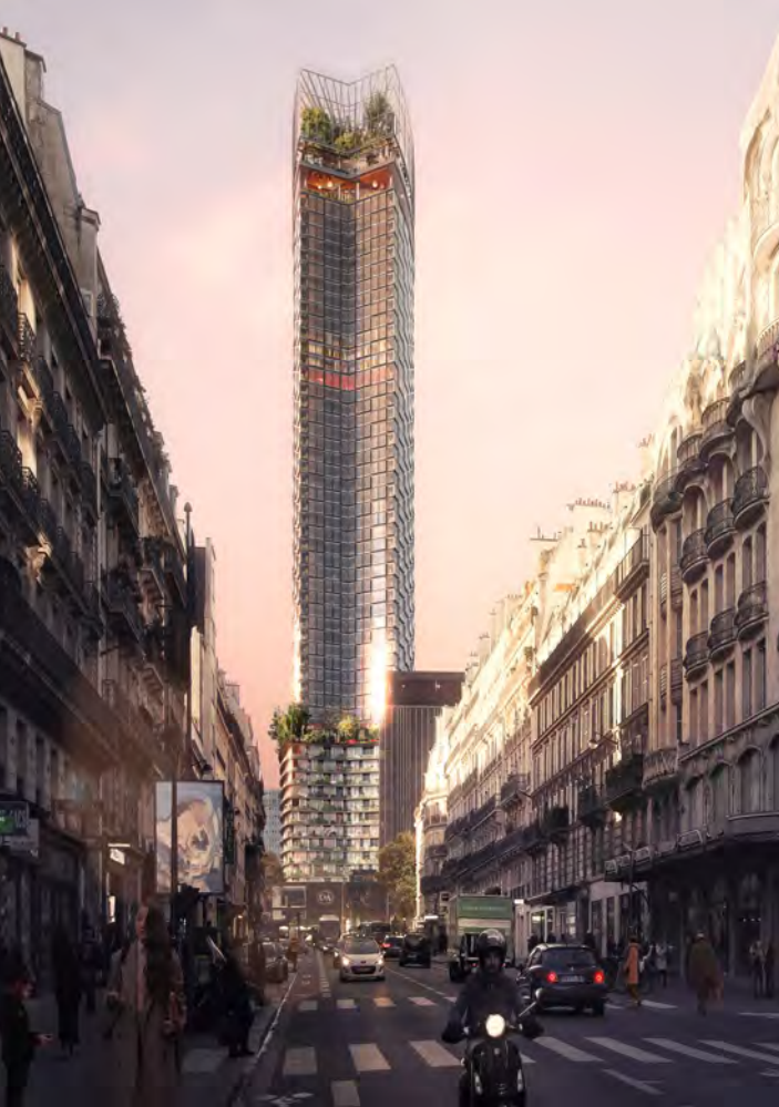
© Nouvelle AOM / Luxigon Vue rue de Rennes