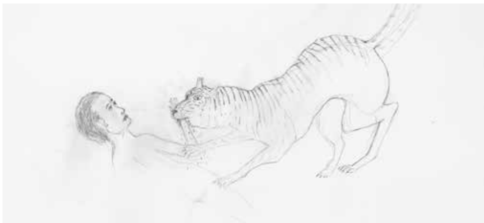
KIKI SMITH Tiger biting Forearm, détail 2002 57,2 x 76,8 cm

Parmi les artistes engagés et militants, nous avons choisi de montrer les militantes, les femmes, qui se sont engagées dès la deuxième moitié du siècle dernier pour porter haut et fort la voix de celles qui, jusqu'à présent, étaient bien rares sur les cimaises des musées et dans les archives de l'histoire de l'art. Les années 1960 et 1970, marquées aux États-Unis par la guerre du Vietnam, les revendications antimilitaristes, les émeutes dans les universités, la répression des étudiants, le mouvement des droits civiques des Afro-Américains et bien entendu la lutte