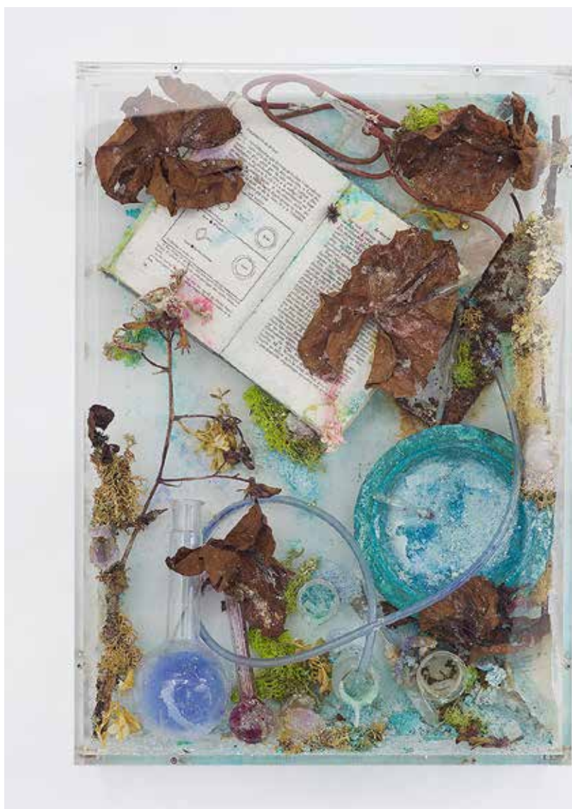
Bloom (Thelma's Heart) 2018

La Lune, citée dans le titre du livre, est un symbole du féminin et, comme la pratique de l'artiste, appelle au progrès scientifique ainsi qu'aux traditions ancestrales et magiques. L'évocation des étoiles au cœur de la vitrine rappelle les forces imprévisibles de la nature.