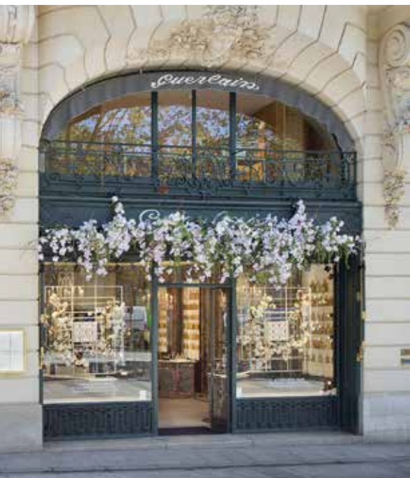
La Maison Guerlain, au 68, Champs-Élysées est l'écrin de toutes les expositions Guerlain.