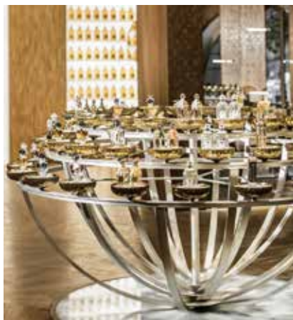
La Maison Guerlain, au 68, Champs-Élysées est l'écrin de toutes les expositions Guerlain.

Les œuvres présentées interrogent alors l'Insolence dans l'art contemporain et font écho à l'attitude audacieuse de la Maison Guerlain. Quel que soit leur registre d'interprétation de l'Insolence, les artistes embrassent avec humour, fougue, outrance, désinvolture ou sérieux la démarche artistique de leur hôte à travers une diversité de supports : vidéo, installation, photographie, peinture.