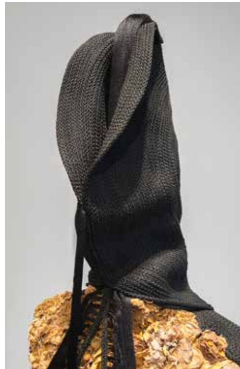
JEANNE VICERIAL Vénus ouverte #1, détail 2020

Le deuxième grand combat, c'est le combat pour les femmes. Ainsi, les femmes sont aujourd'hui centrales dans le management de la Maison. Mais surtout, nous avons lancé en 2021 le programme « Women for Bees », avec l'UNESCO, pour soutenir l'entrepreneuriat féminin en apiculture dans le monde entier. Pendant 5 ans, nous allons financer la formation de 50 femmes, qui pourront ainsi lancer leur entreprise et à leur tour partager leur savoir.