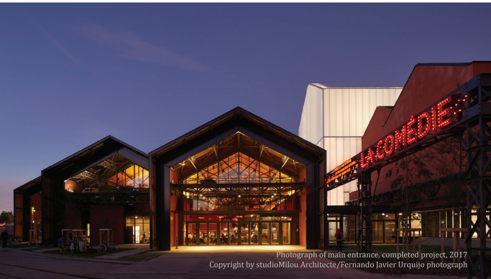
Photograph of main entrance, completed project, 2017