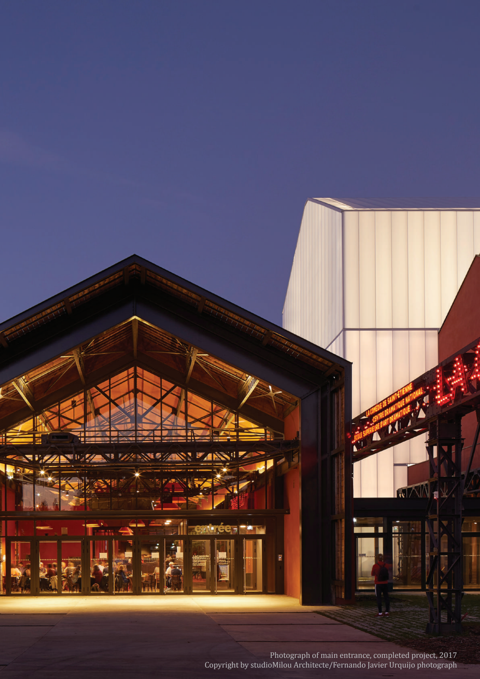
Photograph of main entrance, completed project, 2017 Copyright by studioMilou Architecte/Fernando Javier Urquijo photograph