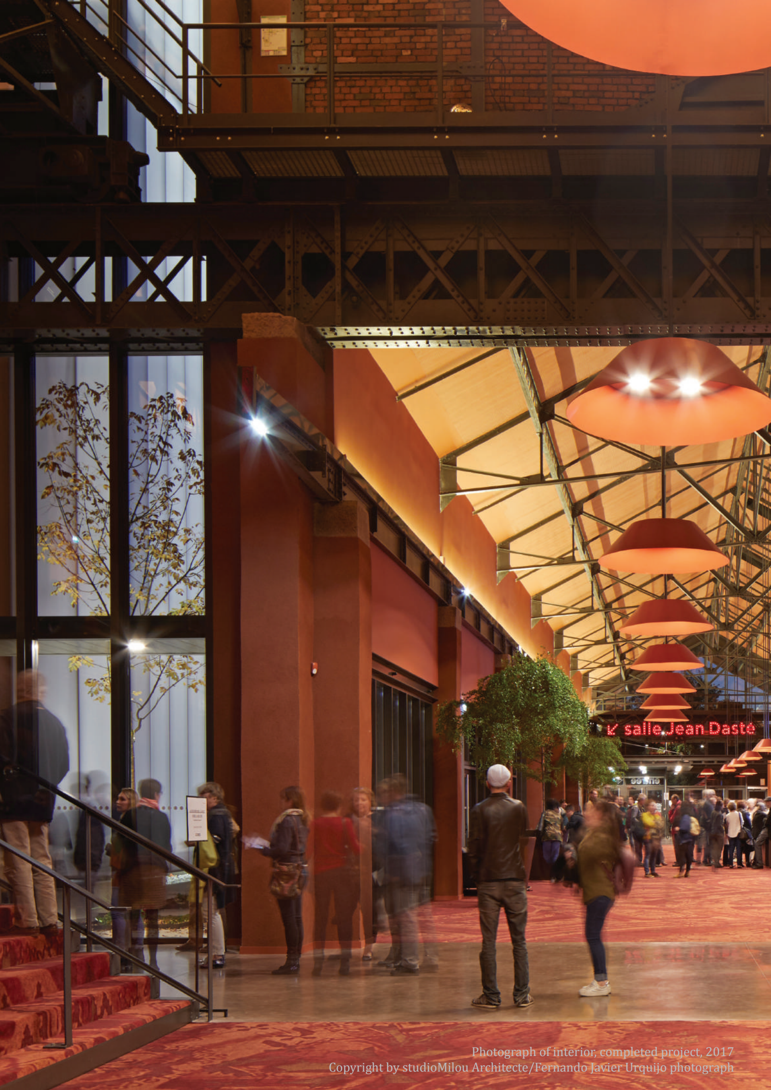
Photograph of interior, completed project, 2017 Copyright by studioMilou Architecte/Fernando Javier Urquijo photograph