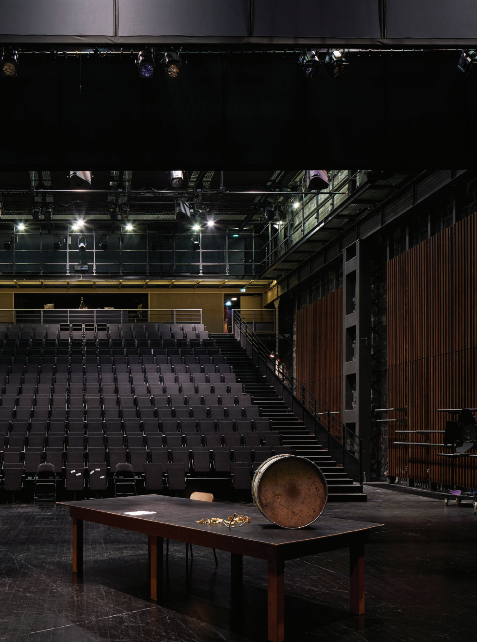
Photograph of small theater, completed project, 2017