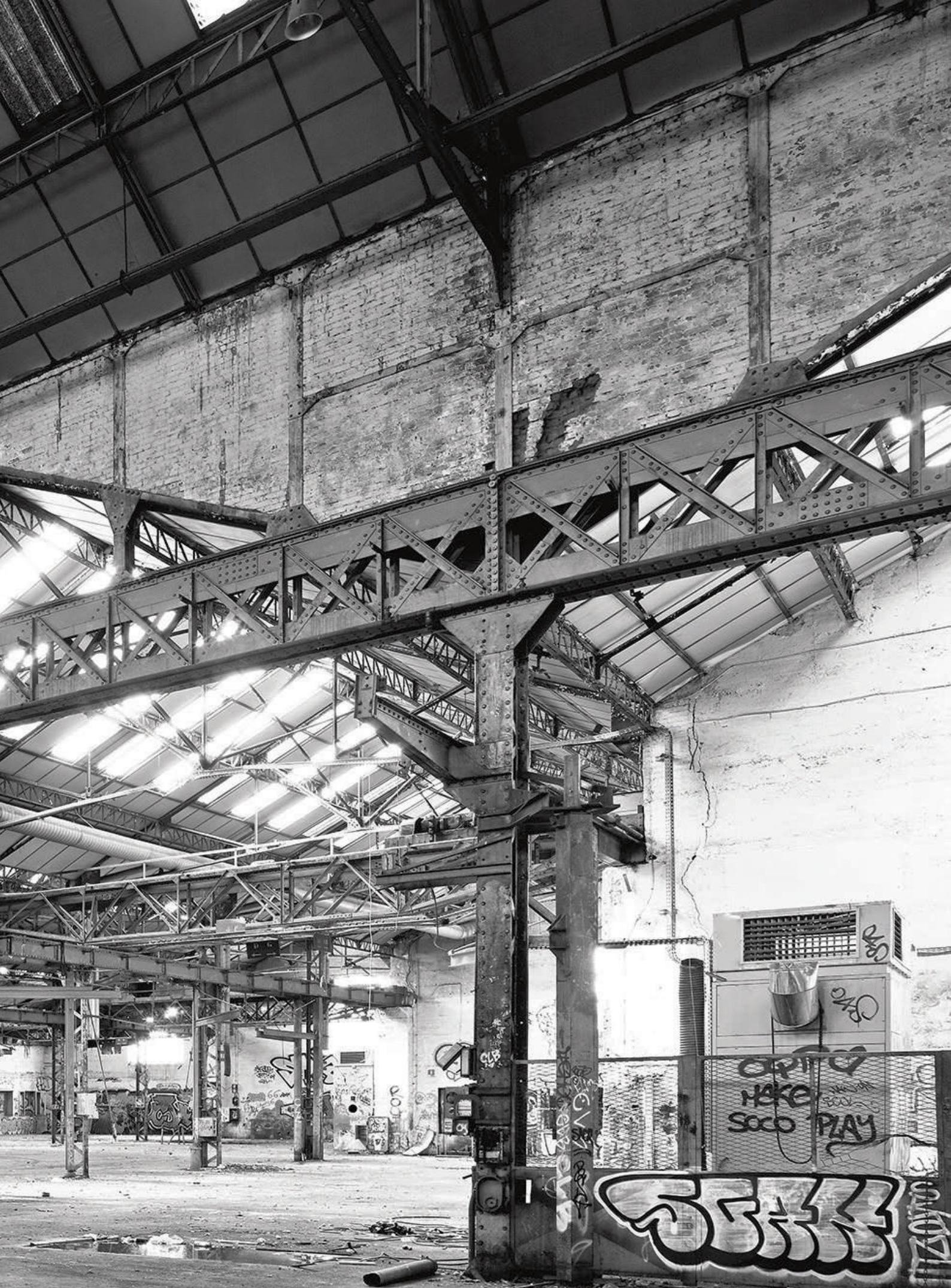
Photograph of the industrial site in 2011