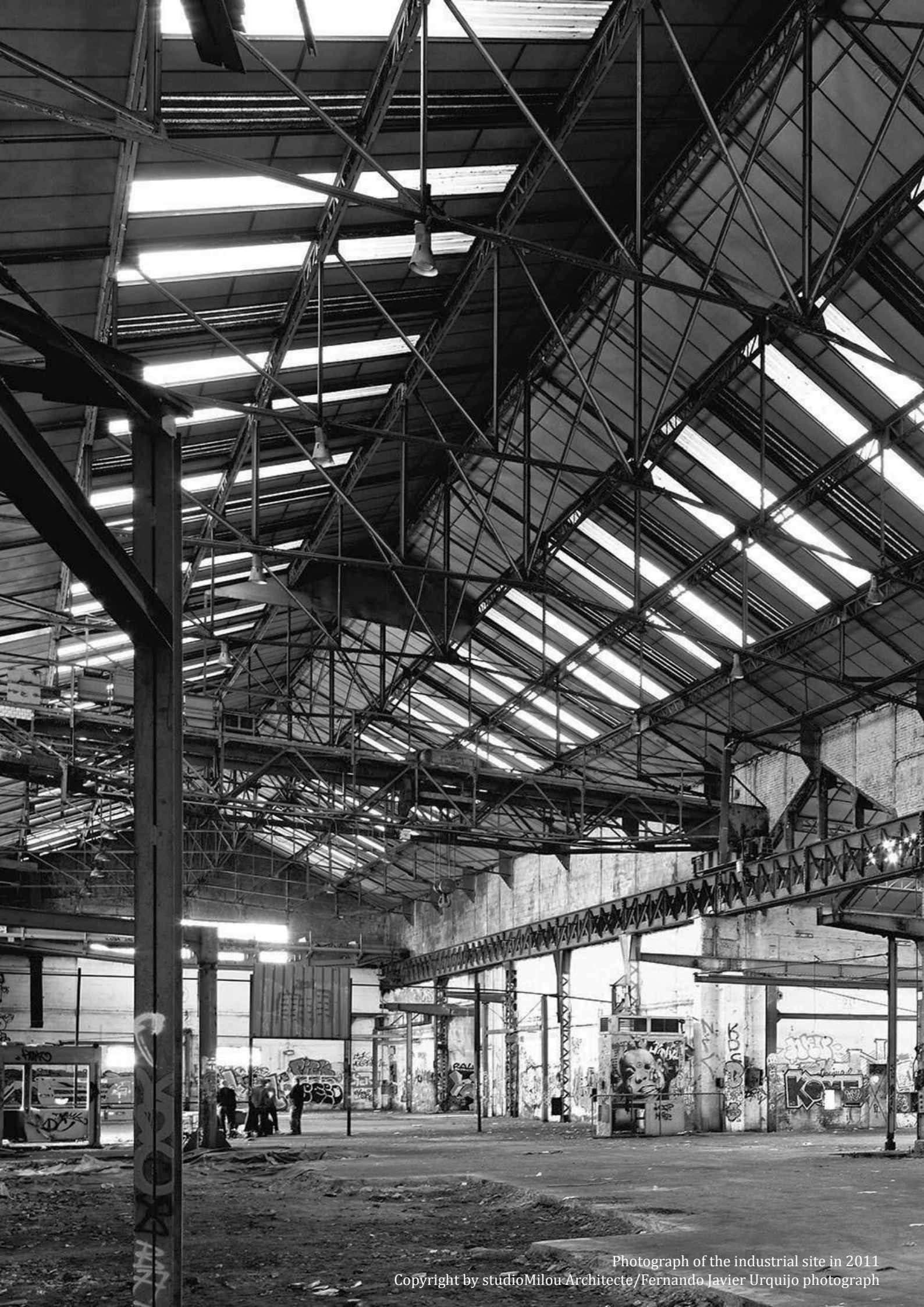
Photograph of the industrial site in 2011 Copyright by studioMilou Architecte/Fernando Javier Urquijo photograph