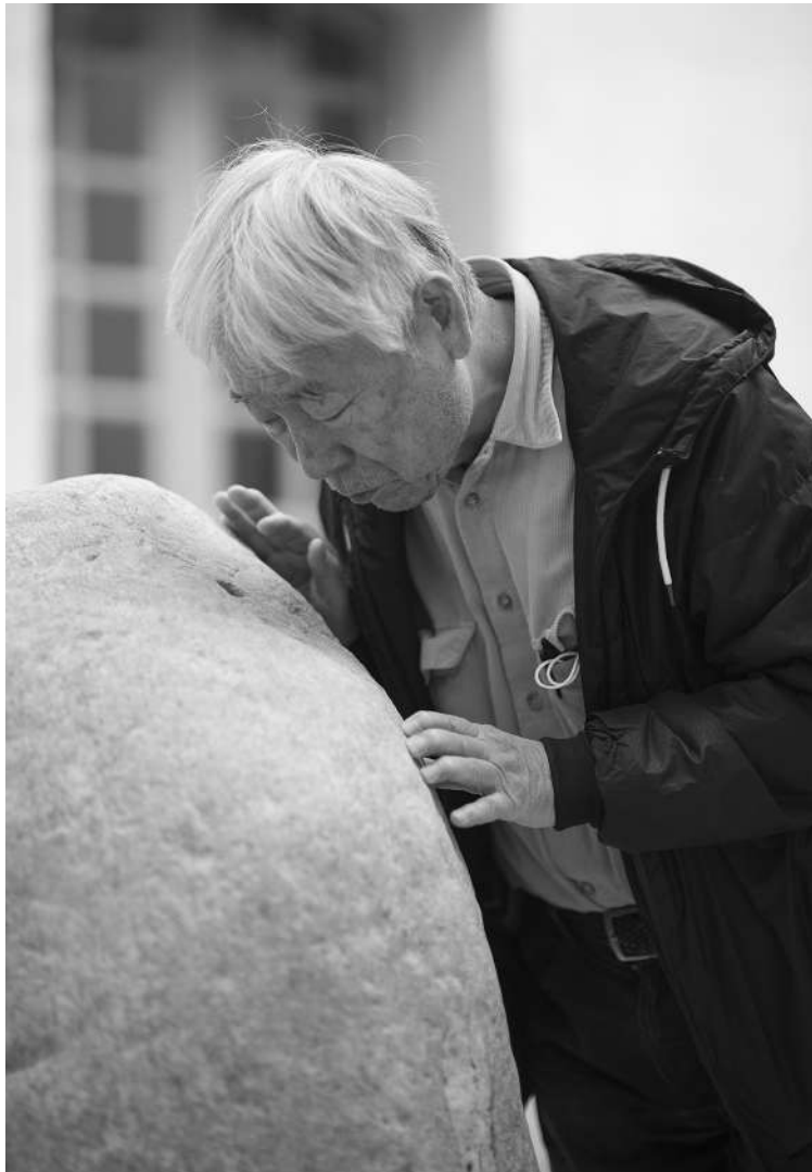
Portrait de Lee Ufan à l'Hôtel Vernon mars 2022