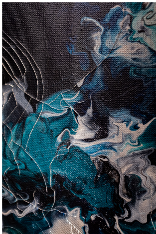
Yana Sidash, Walls of Residential Buildings Burnt by Russian Shelling , 2022.

Fisheye Gallery 2, rue de l'Hôpital-Saint-Louis, 75010 Paris Du mercredi au vendredi 14h-19h | Samedi 11h-18h contact@fisheye-gallery.fr