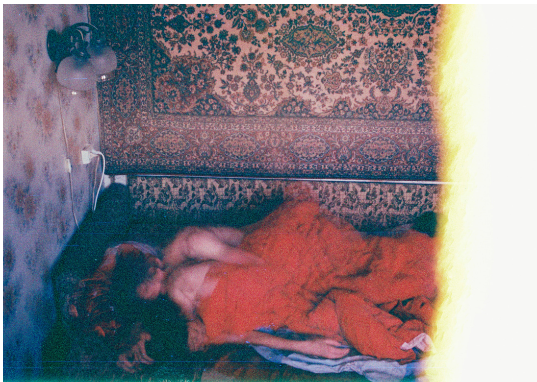
Igor Chekachkov, Sleep , 2017.

Fisheye Gallery 2, rue de l'Hôpital-Saint-Louis, 75010 Paris Du mercredi au vendredi 14h-19h | Samedi 11h-18h contact@fisheye-gallery.fr